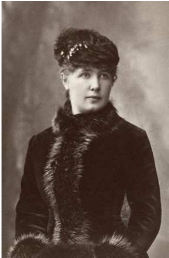
Porträt Oda Krohg