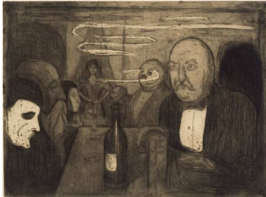
Edvard Munch, Kristiania-Boheme II , 1895 1